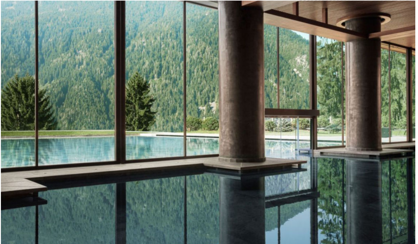
Lefay Resort Dolomiti

Technogym® e pervasa di luce che entra dalle grandi vetrate con accesso diretto ad un giardino con zona relax.