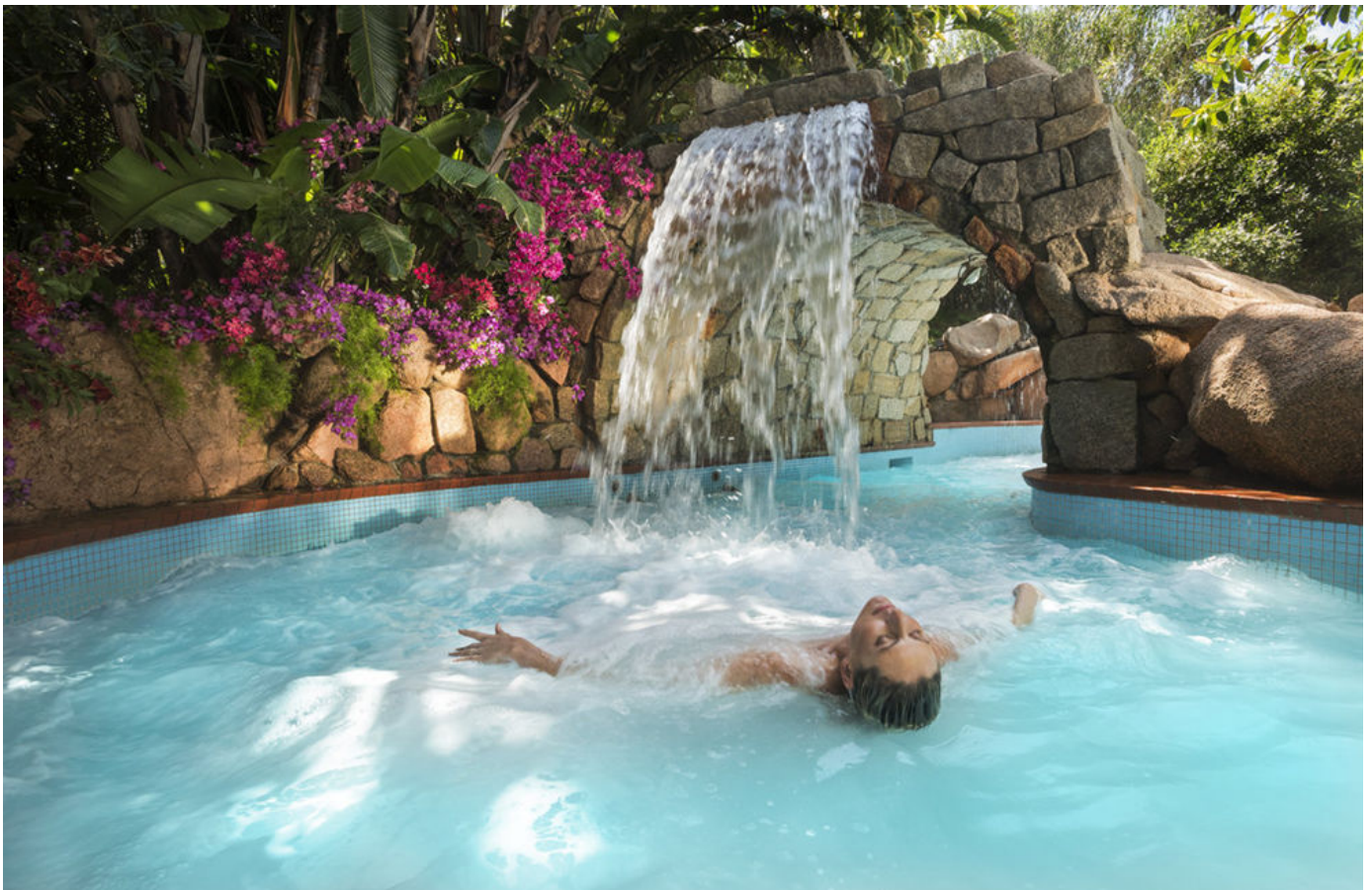
Forte Village Resort – Acquaforte Thalasso & Spa

Il wellbeing tra i nuovi trend dell'ospitalità: gli hotel di lusso rispondono con proposte che combinano il soggiorno in destinazioni straordinarie a trattamenti rigeneranti per corpo e mente e proposte gourmet light. Preparatevi a vivere esperienze uniche