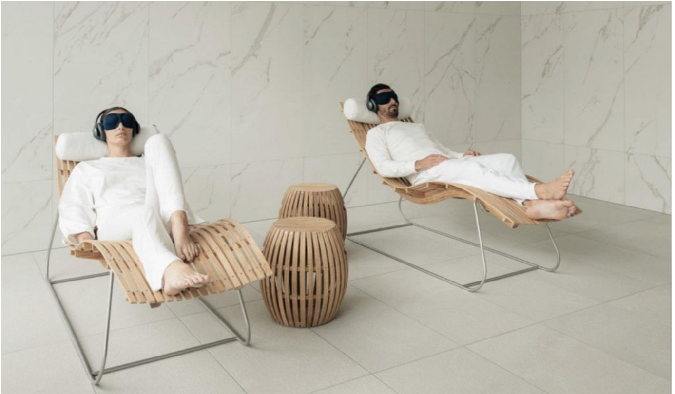
Chenot Palace Weggis

di Lucerna, questo hotel ha una raffinata spa di 5.000 mq affacciata sul bellissimo panorama alpino, un centro medico all'avanguardia e offre una vasta proposta di servizi integrati in grado di soddisfare gli standard più elevati in materia di healthy living. Delineati secondo il Metodo Chenot®, gli screening medici, i trattamenti e i programmi di cura disponibili a Weggis – Advanced Detox, Recover & Energise e Prevention & Ageing Well – sono studiati ad hoc per ogni ospite e vengono abbinati a un regime alimentare personalizzato che rispetta i pilastri della Dieta Chenot: detossinare l'organismo, stimolare il metabolismo e promuovere la rigenerazione cellulare utilizzando ingredienti di prima qualità, non trattati e ricchi di nutrienti dalle proprietà antinfiammatorie, antiossidanti, antiglicanti e alcaline.