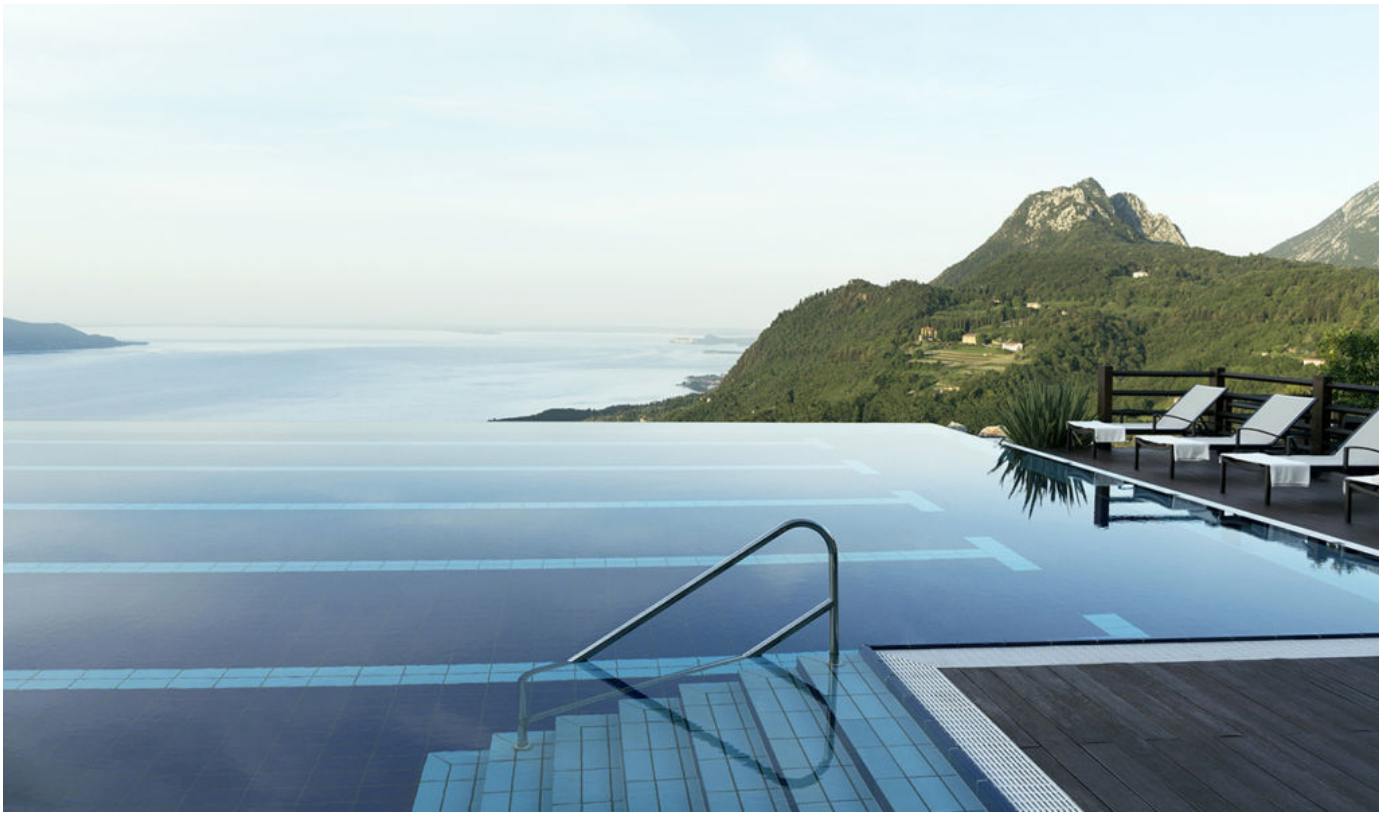
Lefay Resort &amp; SPA Lago di Garda

Per chi cerca lo stile di vita mediterraneo fatto di relax e divertimenti, cene eleganti, intrattenimento serale e spettacoli il Forte Village Resort – Acquaforte Thalasso & Spa è la destinazione perfetta. Un luogo che resta un unicum al mondo dove potersi rilassare in totale armonia con la natura, rimettersi in forma e respirare a pieni polmoni il “sangue vegetale” del parco secolare, la clorofilla, e lo iodio del mare cristallino, che aiuteranno a rigenerarsi nel corpo e nello spirito. Il Forte Village è una vera e propria ‘destinazione nella destinazione’. Otto eleganti hotel, 4 e 5 stelle, completamente ristrutturati seguendo i più attuali standard di comfort e servizio, tredici ville per chi desidera la più assoluta privacy coccolati da mille piccole attenzioni e più di quaranta suite. 21 ristoranti, 100 chef e una cantina con 600 etichette selezionate tra le eccellenze italiane e internazionali. Questi i numeri che fanno intuire il percorso gastronomico senza eguali del resort.