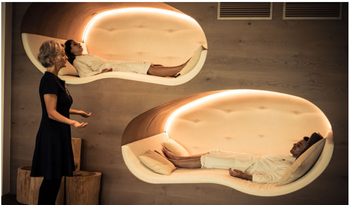
Preidlhof Luxury DolceVita Resort

Tanti gli indirizzi di hotel e resort in Italia . Ecco i suggerimenti di HotelmyPassion , il sito lifestyle pensato per i 'Travel & Hotel Lovers' che ricercano esperienze uniche e distintive.