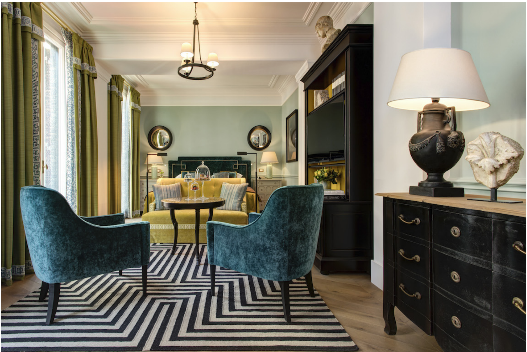
RFH Hotel de la Ville, Roma

All'interno della sezione "Hotel", ogni albergo ha una scheda dedicata, con indicati il punteggio assegnato dalla redazione, la categoria, i benefit a disposizione del cliente e le chicche che possono rendere speciale il soggiorno. Dal viaggio in vespa compreso nel pacchetto "Vintage tour", alla Spa, al campo da golf.