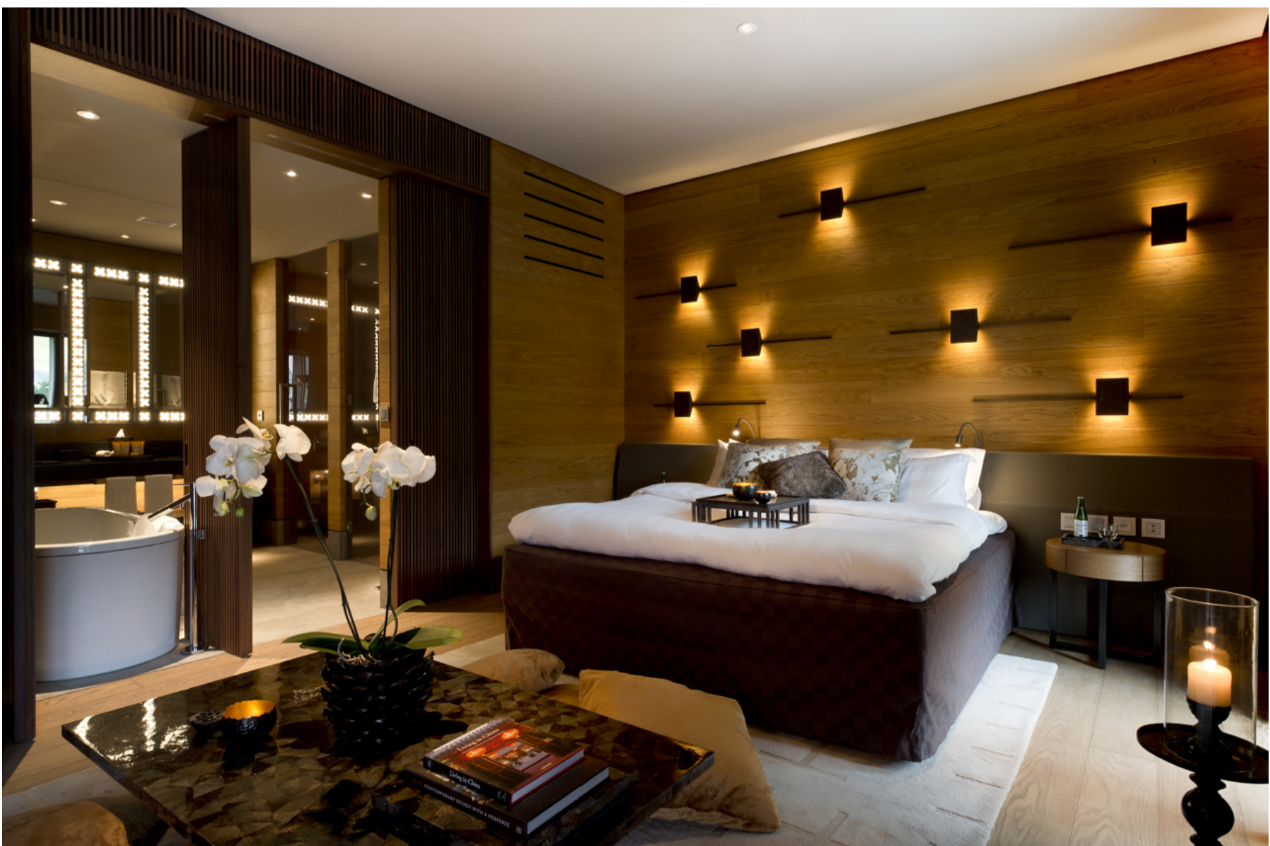
The Chedi Andermatt, Andermatt, Svizzera

All'interno della sezione "Hotel", ogni albergo ha una scheda dedicata, con indicati il punteggio assegnato dalla redazione, la categoria, i benefit a disposizione del cliente e le chicche che possono rendere speciale il soggiorno. Dal viaggio in vespa compreso nel pacchetto "Vintage tour", alla Spa, al campo da golf.