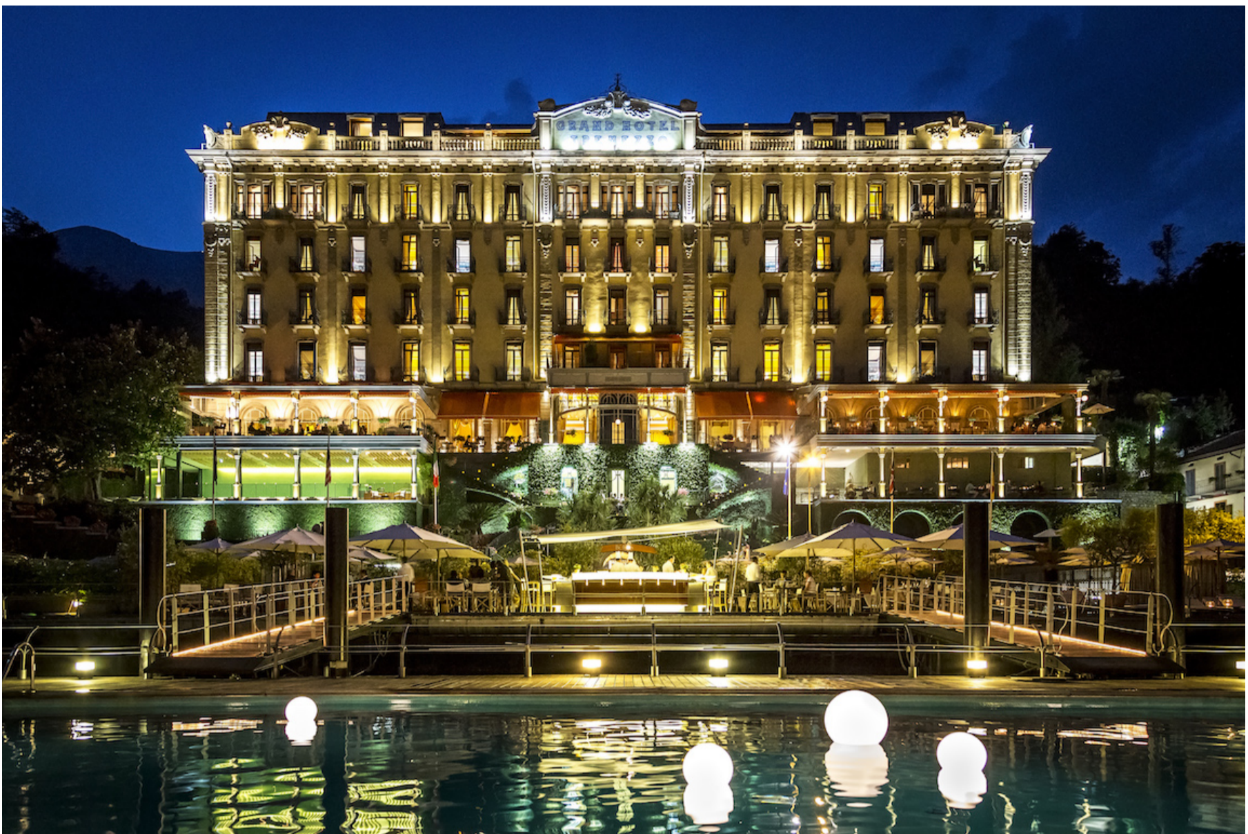
Grand Hotel Tremezzo, Como